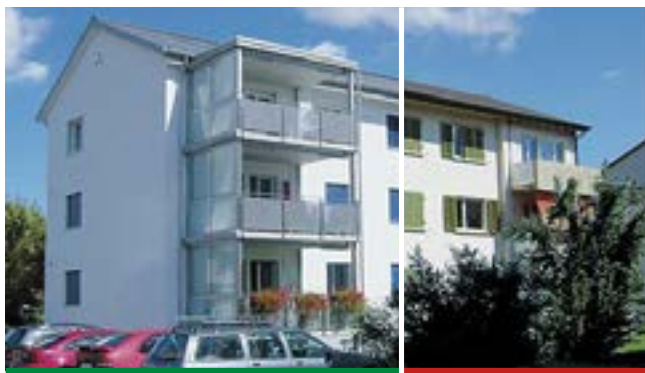
Eine gute Planung ermöglicht effektive und finanziell sinnvolle Gebäudemodernisierungen. Links modernisiertes Gebäude, rechts vor der Modernisierung.